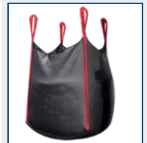
Big Bag Geo-Textiel 190 gr/m 2